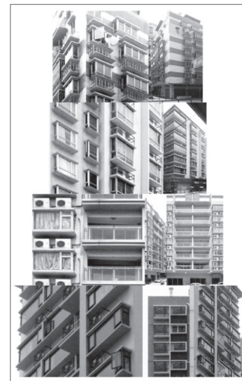
O novo milénio

Todavia restabeleceu-se uma prática consistente na renovação da cidade, nomeadamente nos bairros antigos, se bem que menos dedicada ao exercício exploratório do discurso arquitectónico ou à invenção.